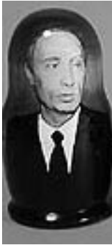
Präsident Wladimir Putin: Wie verändert er Russland? Welche Ideen stecken in ihm?

Mit der Konsolidierung der Regierung Putins zeigt Russland ein neues Profil. Anders als sein Vorgänger leitet Putin die Amtsgeschäfte aktiv, wobei er als eine Art autoritärer Modernisierer auftritt. Putin versucht, sich von einigen Oligarchen und von regionalen Verwaltungsleitern unabhängig zu machen, die seine Präsidentschaft einst protegieren. Wirtschaftlich wächst Russland erstmals wieder – nach über zehn Jahren Krise allerdings von einem sehr geringen Niveau aus. Spricht von wirtschaftlicher und politischer Seite einiges für die Verringerung der Krisen, fehlt es nach wie vor an der entsprechenden gesellschaftlichen Unterstützung. Es mehren sich gar Befürchtungen über Einschränkungen der bürgerlichen Freiheiten.