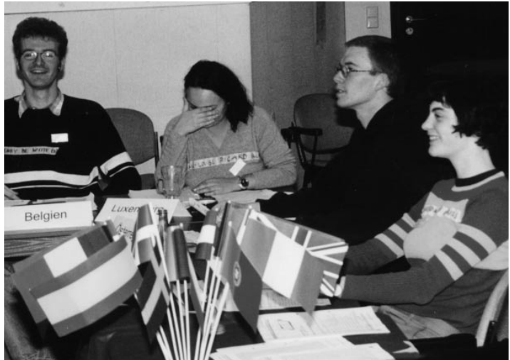
Planspiel zur EU-Erweiterung: Die jungen Leute diskutieren bis in die Nacht