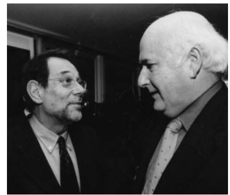
Gespräch mit dem Hohen Beauftragten für die Gemeinsame Außen- und Sicherheitspolitik Solana