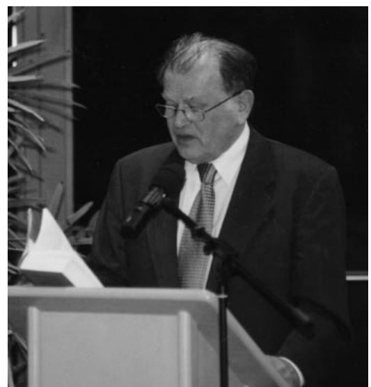
Der Schriftsteller und ehemalige politische Häftling Erich Loest liest aus seinem Buch „Durch die Erde ein Riss“.

Auf dem Programm stand auch der Besuch des ehemaligen Staatsgefängnisses Bautzen. Das Gefängnis für politische Häftlinge der ehemaligen DDR ist heute als historische Gedenkstätte der Öffentlichkeit zugänglich. Die Netzwerkteilnehmer nahmen an einer Führung teil und hatten Gelegenheit, mit einem ehemaligen Insassen über dessen persönliche Hafterfahrung zu sprechen. Ein besonderer Höhepunkt der Konferenz war die Dinnerspeech des Schriftstellers Erich Loest, der in Bautzen inhaftiert war und seine Erlebnisse literarisch verarbeitet hat. Die Lesung aus seinem Buch „Durch die Erde ein Riss“ eröffnete den Zuhörern einen Einblick in den Gefängnisalltag und die inneren Konflikte, die Loest als politischer Häftling durchleben musste.