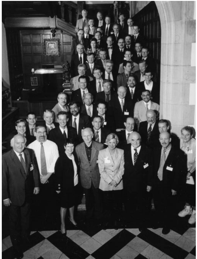
Die Gesprächsteilnehmer in Kronberg