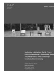
FORSCHUNGSGRUPPE ZUKUNFTSFRAGEN / AVENTIS FOUNDATION (HRSG): Sustaining a Globalized World: Future Paths to Developing a Sustainable Society München 2001, ISBN 3-933456-14-2, 50 Seiten, im Internet

Geschwindigkeit und Komplexität sind Markenzeichen moderner Globalität. Multinational operierende Unternehmen, expandierende Kapitalmärkte, der wachsende Stellenwert technologischen Know-hows, das Internet und eine zunehmende Zahl von politisch aktiven Netzwerken und Akteuren prägen unsere Zeit. Konventionelle Ordnungsmodelle und Regierungsstile zeigen sich durch die Herausforderungen des sozialen und technologischen Wandels häufig überfordert. Zunehmend stellt sich die Frage, wie nationale Regelungsansätze durch ein Konzept der Global Governance ergänzt werden können, um nachhaltige Politikmodelle neu zu installieren. Die Broschüre entstand im Rahmen des 2. Triangle Forums, welches das Centrum für angewandte Politikforschung und die Aventis Foundation im Sommer 2000 im Watermill Center des renommierten amerikanischen Regisseurs Robert Wilson mit rund fünfzig Teilnehmern aus Amerika, Asien und Europa durchgeführt haben. Sie enthält ein Impulspapier, das die Diskussionen auf dem Forum strukturierte, und einen ausführlichen Bericht zum Forum. Unter www.aventis-forum.uni-muenchen.de kann sie heruntergeladen werden.