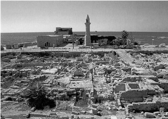
Caesaria – einst Residenz der römischen Statthalter in Israel, heute Tagungsort für europapolitische Konferenzen. Das Bild zeigt den alten Hafen.