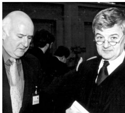
Freute sich über die Rückendeckung zur Finalität Europas: Außenminister Joschka Fischer