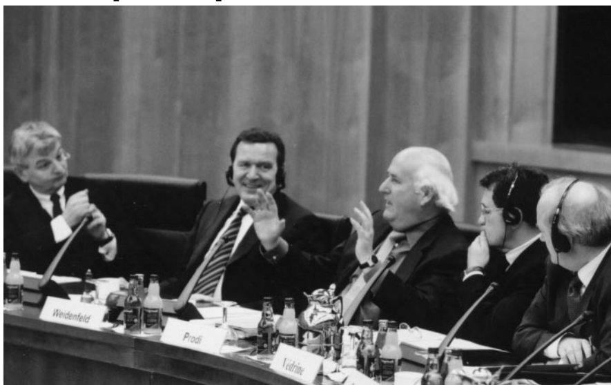
Sichtlich entspannte Atmosphäre beim International Bertelsmann Forum im Auswärtigen Amt

Die harten Verhandlungen in Nizza um Stimmenmehrheiten und Veto-rechte hatten Spannungen produziert. Beim International Bertelsmann Forum in Berlin aber konnten die politischen Akteure – darunter sechs Staatspräsidenten und Regierungschefs sowie neun Außenminister – über das Tagesgeschäft hinausdenken und in konzentrierter Atmosphäre den großen Fragen nachgehen. „Fünf Wochen nach Nizza ist es an der Zeit, nach ordnenden Orientierungen, Konzeptionen und Denkmodellen zu suchen, wie die Europäer ihr Haus gestalten wollen“, sagte Professor