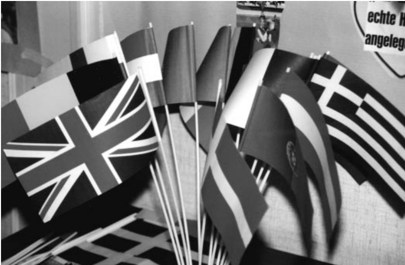
EU und EU-Erweiterung – eine Herzensangelegenheit der Bürger?

Jugendlichen die Vollendung Europas näherzubringen, hat sich die Forschungsgruppe Jugend und Europa (FGJE) am C·A·P zur Aufgabe gesetzt. In einem gemeinsamen bundesweiten Projekt mit dem Presse- und Informationsamt der Bundesregierung und dem Informationsbüro für