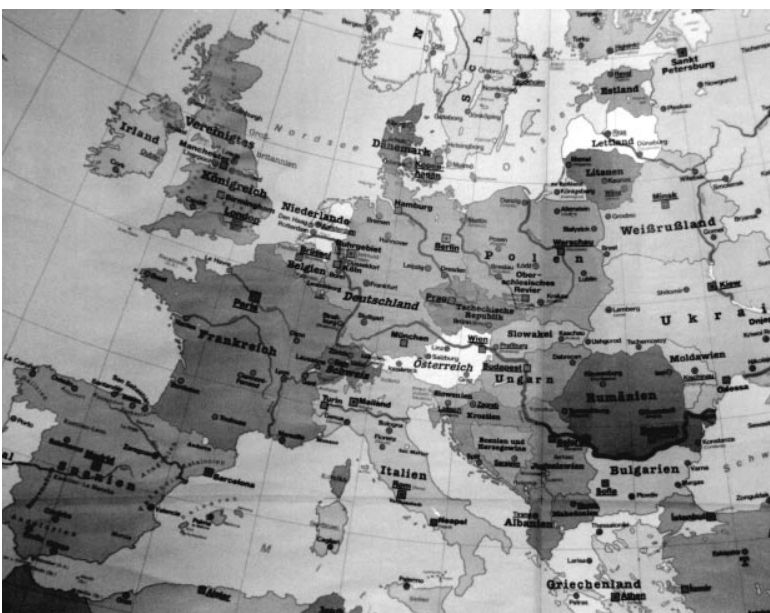
Europa im Schulunterricht. Wer versteht die Entscheidungsprozesse, wo liegen Chancen und Risiken einer Erweiterung?

Die Entscheidungsprozesse und Konfliktlinien der gegenwärtigen Beitrittsverhandlungen werden im Planspiel in vereinfachter Form simuliert. Die Spieler agieren auf der Grundlage von Rollenprofilen und Hintergrundinformationen als politische Akteure (z.B. als Ministerin, als Vertreter eines Beitrittskandidaten oder als Abgeordnete des Europäischen Parlamentes). Die Teilnehmer gewinnen einen Einblick in die legitimen Interessen und Problemlagen einzelner Akteure und entwickeln ein besseres Verständnis für die Prozesse politischer Entscheidungsfindung in der Europäischen Union.