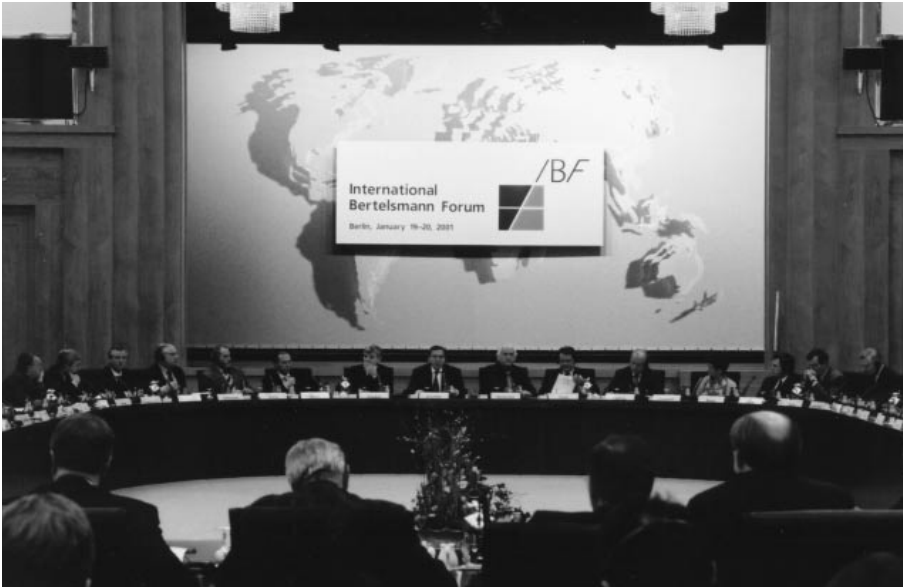
Wie lässt sich ein Europa mit 28 Mitgliedstaaten integrieren? Die Akteure aus West- und Osteuropa suchten beim Bertelsmann Forum im Welsaal des Auswärtigen Amtes nach Lösungen.

Mit dem Ergebnis von Nizza werden sich derartige Umwälzungen nicht produktiv umsetzen lassen – dieses