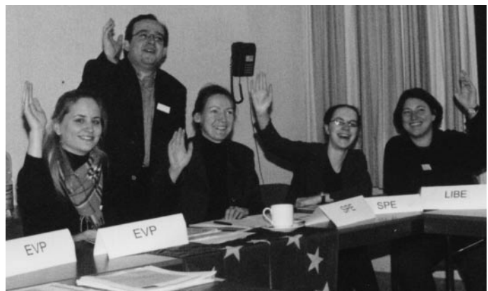
Einstimmigkeit im Europäischen Parlament: Die Vertreter sind für eine schnelle Erweiterung